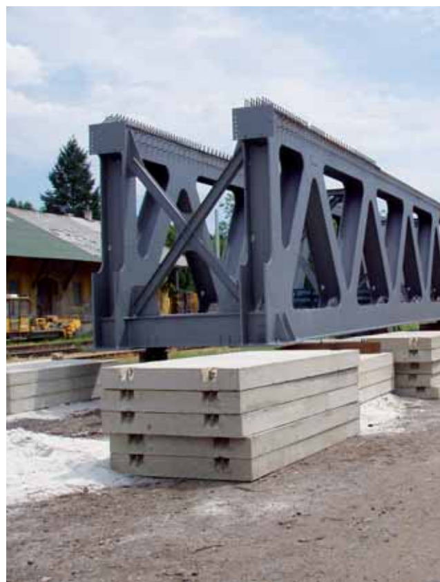
Železniční most Klášterec nad Ohří ← autobusové nádraží Praha-Letňany